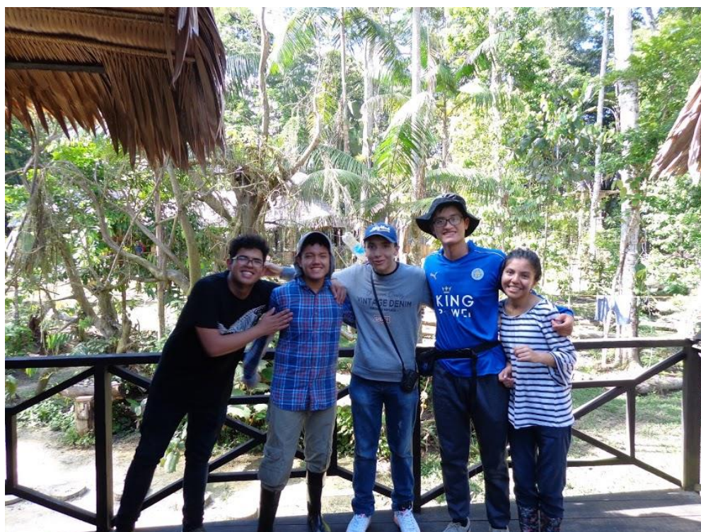
Excursión promoción 2018. Liceo Campo David.