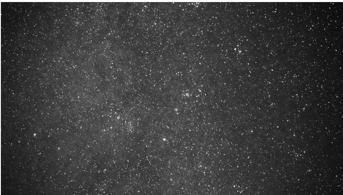
Universo estrellado. Reserva Natural Acapú. 2019.