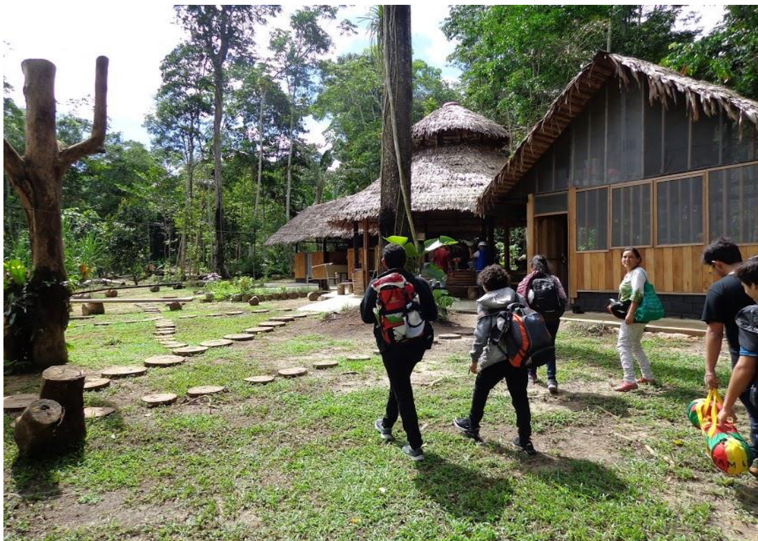
Excursión promoción 2018. Liceo Campo David.