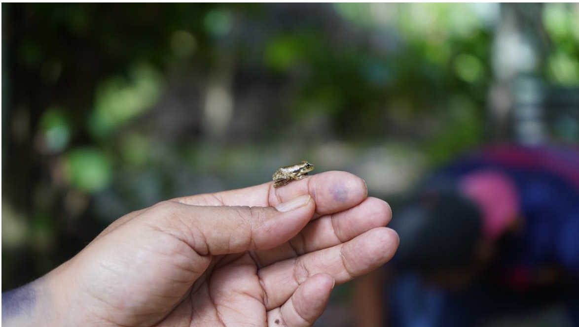
El universo de las cosas pequeñas. Reserva Natural Acapú. 2019.