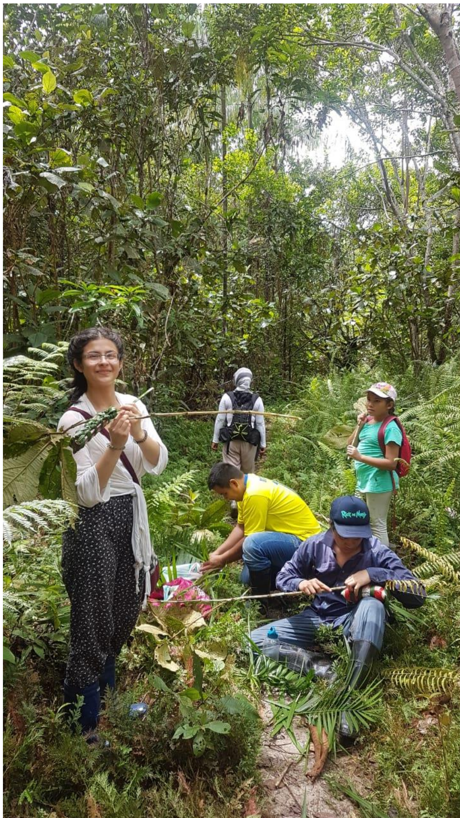
Tejiendo. Excursión promoción 2018. Liceo Campo David.